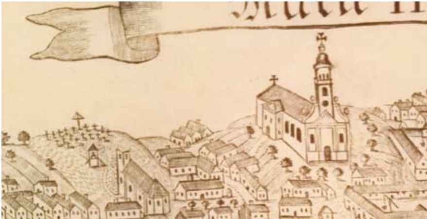
3. kép Hőgyész középkori és jelenlegi temploma (1800 k.) Az eredeti rézlemezzel készült 20. századi nyomtatás részlete, a szerző tulajdona.