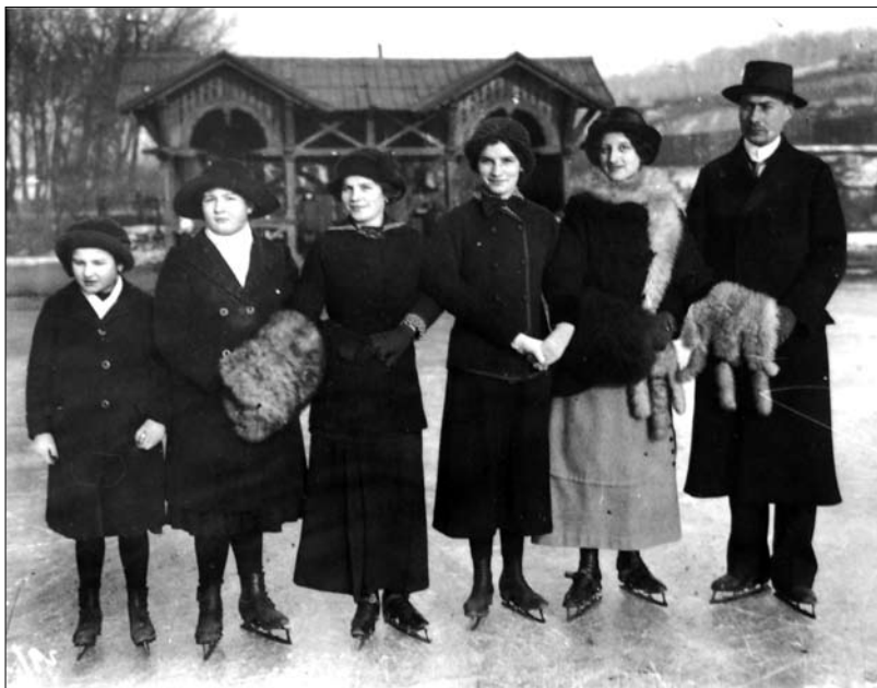
6. kép Korcsolyázók az acélgyári jégpályán az 1930-as évek legelején. Dornyay Béla Múzeum Fotótára ltsz. 17409.

A kutatásnak ezen a pontján még számos fehér folt és kérdés nehezíti a pontos kép megrajzolását, mégis annyi már biztosnak mondható, hogy az acélgyári kolónia lakossága a második világháború előtt rendezett utcáival, dekoratív házaival kiemelkedett a város szélesebb társadalmából és igyekezett lépést tartani az „úri- asabb” pesti divattal is. Mindezzel mintaadóként léphetett fel a város többi ipari kolóniájának lakossága előtt. Ahogy mondták, a bányai és az üveggyári lányoknak dicsőség volt acélgyári vőlegényt találniuk. A jelenség mögött részben valós tények húzódnak meg, például a jobb kereseti viszonyok, részben kimondottan a kifelé erőteljesen mutatott önkép érvényesülése, amely mögött valójában nincsenek kiugró különbségek. Erre jó példa, hogy az acélgyáriakat egyértelműen „elitnek” és „munkásarisztokráciának” aposztrofáló üveggyári interjúalanyom nem tudta megmondani, hogy pontosan miben is különböztek külsőleg a két kolónia lakói. A Rimamurányi városrész különállása a negyvenes évek második felében megszűnt. A kiépülő kommunista diktatúra erőszakos ki- és betelepítései felbolygatták a kolónia társadalmát. Az emeletes panelházak felépítése megtörte az addig harmonikus utcaképet, a háború utáni nyersanyaghiány és az uniformizálás pedig gyökeresen átalakította az öltözködést és a divatot. 43