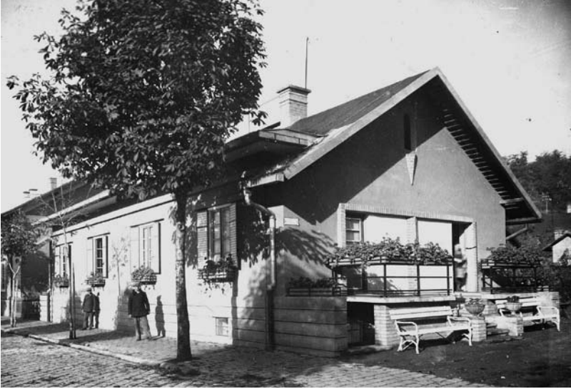
2. kép Acélglyári munkáslakóház az 1930-as évek közepén. ltsz. 804_6_811.

ja a vállalat írott rendtartása volt. A 2014-ben készített interjúkból kiderült, hogy a megszólásnál súlyosabb megszegyenítő büntetéseket (fizikai bántalmazás, kiközösítés, megszegyenítés) a közösség nem helyeselte és nem is volt rá módja, hogy gyakorolja, hiszen a gyárvezetőségre tartozott minden durvább kihágás, normaszegés miatti elmarasztalás, mely legvégső esetben a kolóniáról történő eltávolítást vont maga után. A legsúlyosabb büntetés előtti lépés volt az úgynevezett „Döhöngöbe” küldés. A szoba-konyhás munkáslakásokból álló Dühöngőnek nevezett teleprész a gyár melletti hegyoldalon, a Jónásch-telep szélén volt. Hivatalos dokumentumokban nem bukkant fel ez az elnevezés, csak a telepiek hívták így egymás között.