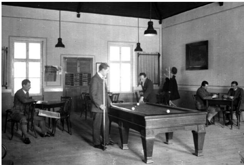
3. kép Az acélgáryi Munkás Kaszinó biliárdterme az 1930-as évek közepén. Dornyay Béla Múzeum Fényképtára ltsz. 2432.

A nyilvános terek használatának vizsgálatakor az utcakép mellett mindenképpen szót érdemelnek a szabadidő eltöltésére szolgáló nyílt és zárt terek is. A vállalat igyekezett szervezett szabadidővel távol tartani munkásait a politizálás veszélyeitől, ezért sportolásra és kikapcsolódásra egyaránt alkalmas tereket alakítottak ki. A férfiak szabadidejüket legszívesebben a Munkás Kaszinóban, vagy más néven Olvasóban és a nyári kuglizóban töltötték el. A kuglizó kerthelyiségében tavasztól ősziig szívesen időztek. „Az olvasó-egylet tulajdonképpen munkás-kaszinó, ahol billiárdterem, ivószoba, kuglizóhelyiség és kert van a tagok használatára, de emellett nemesebb irányú szórakozásra is nyújt alkalmat.” 8