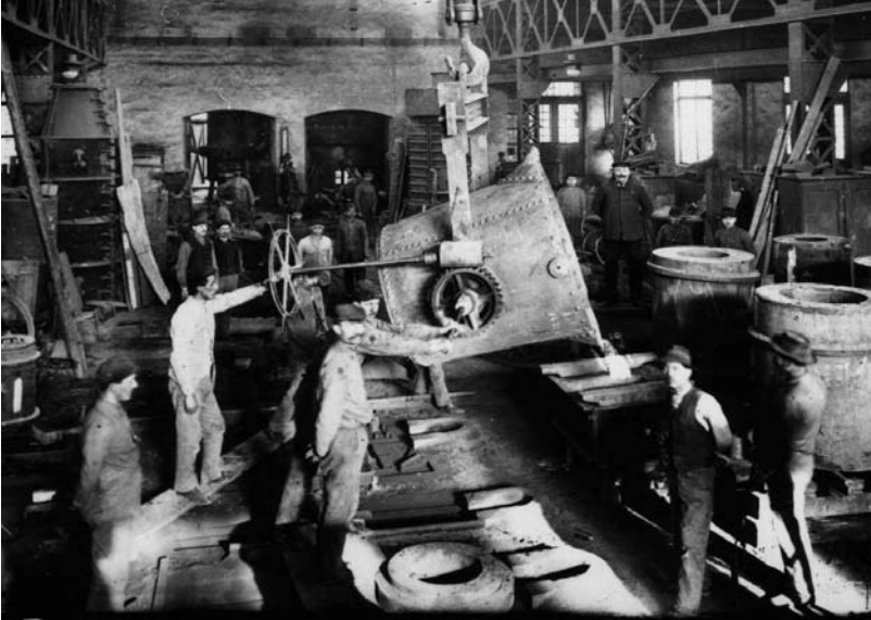
4. kép Acélgyáriak munka közben az 1930-as években. Dornay Béla Múzeum Fotótára 2428.

Az üvegyárnál szintén igyekeztek jólöltözöttek lenni, elsősorban nem is az igényekben mutatkozott meg a két kolónia lakossága közötti különbség, hanem a lehetőségekben. Az interjúk alapján úgy tűnik, hogy még egy üvegfúvó családban is csak maximum három vagy négy pár cipővel rendelkeztek, inkább sapkát hordtak kalap helyett, és bár báli alkalmakra itt is szmokingot öltöttek a férfiak, a ruhadarabok száma jelentősen kevesebb volt, mint az acélgyáriak esetében. Tehát nem a ruhák minőségében volt különbség, hanem a mennyiségében, ebből fakadóan előbb is lettek viseltesek, hiszen nem volt lehetőségük a gyakori cserére.